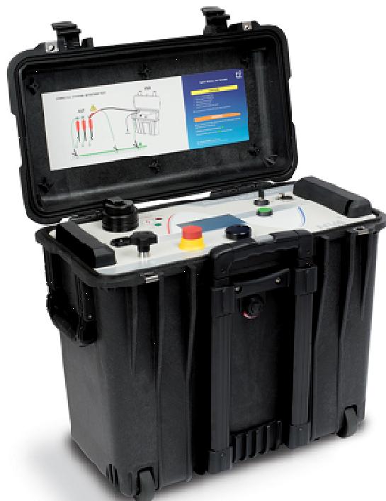
Рисунок 4 - Общий вид установок НВА34-1, НВА45